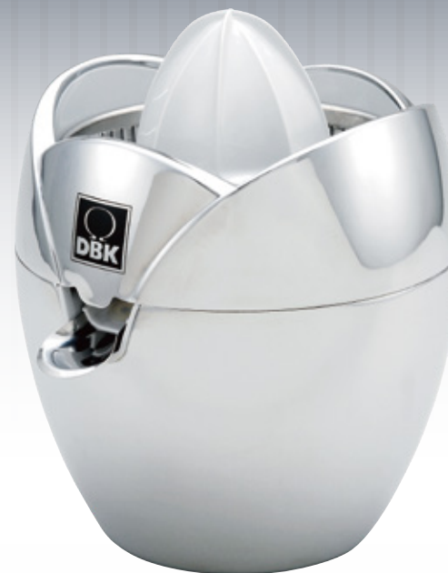
CJ65L 希望小売価格 24,200円 (税抜価格 22,000円) JANコード:4984259700002