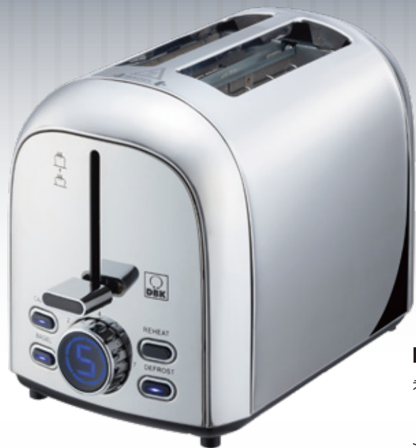
DKT090SS 希望小売価格 13,200円 (税抜価格 12,000円) JANコード:4984259715174

● ベーグルボタン(BAGEL) 外側のヒーターのみ加熱します。 ベーグルなど片面をトーストする 際にご使用ください。